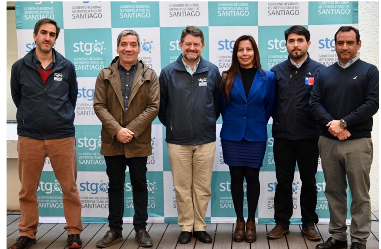
PROGRAMA MAIPO RESILIENTE ESTRATEGIA HÍDRICA LOCAL