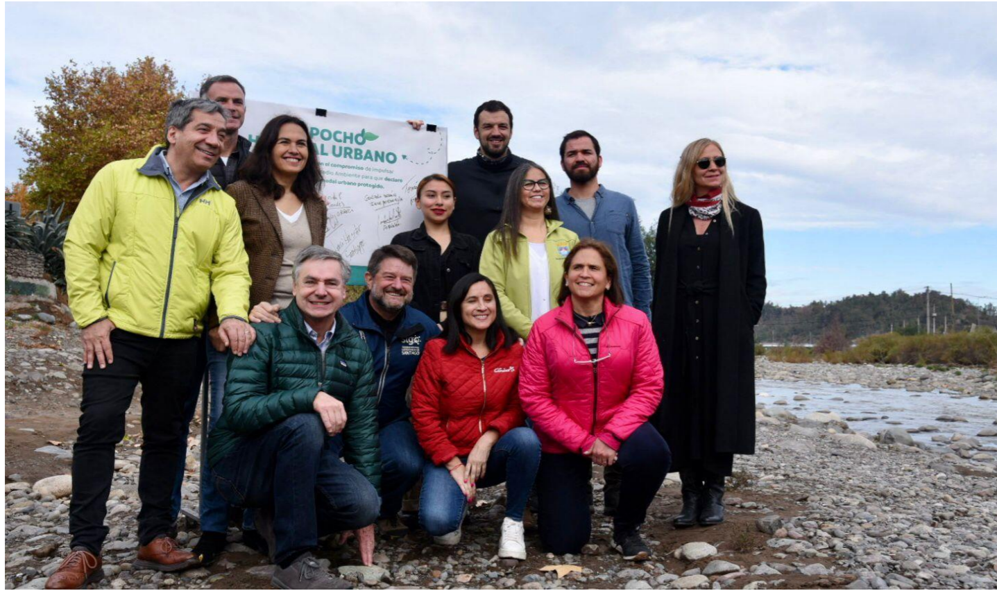
DECLARACIÓN DE HUMEDAL URBANO