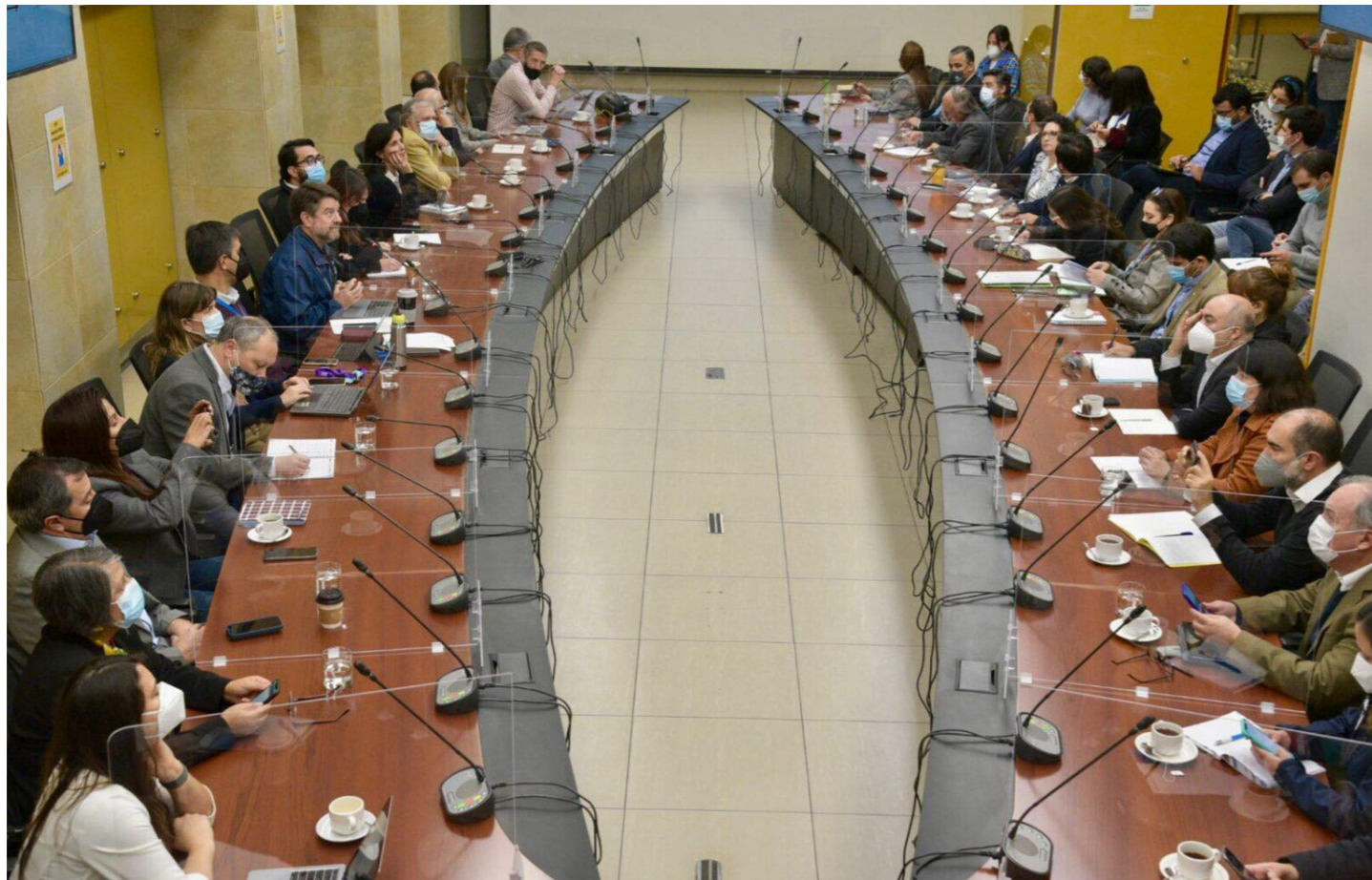
MESA DE EMERGENCIA HÍDRICA