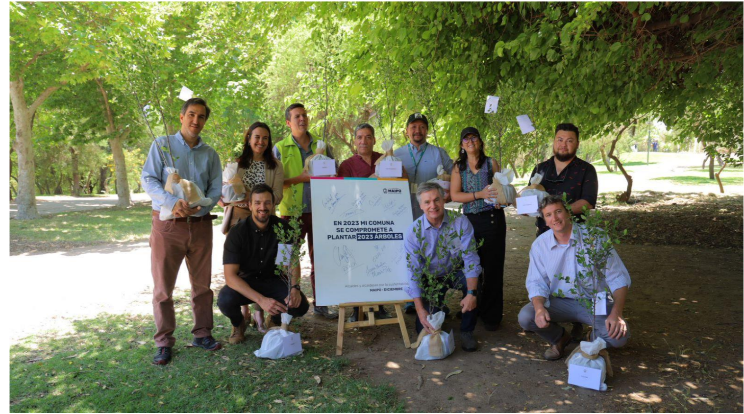
COMPROMISO DE REFORESTACIÓN